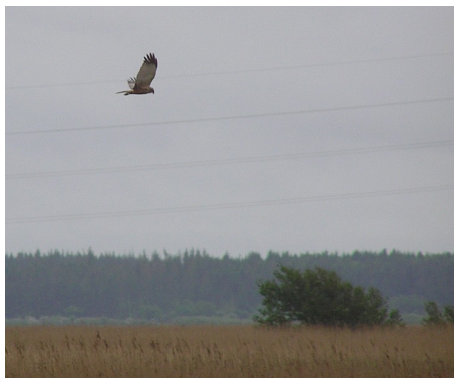
Rørhøg - han, Circus aeroginosus, han, fouragerende over Han Vejle, d. 30. maj 2007

Over rørene fouragerede en Rørhøg han i længere tid :