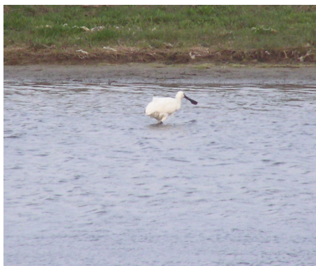
Skestork, Platalea leucorodia, fouragerende i Løgstør Bredning ved Vejlerne, d. 29. maj 2007

Efter "indkvarteringen" kørte vi ned på Bygholm-dæmningen for at se, om vi kunne få lidt fugle her sidst på dagen. I mellemtiden var det rent faktisk holdt op med at regne - en helt ny fornemmelse !! Ude i Limfjorden eller rettere sagt i den del af fjorden, der hedder Løgstør Bredning gik en Skestork og skummede overfladen :