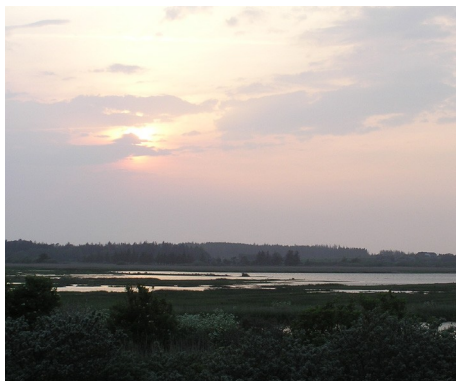
Solnedgang over Glombak ved Vejlerne, d. 29. maj 2007