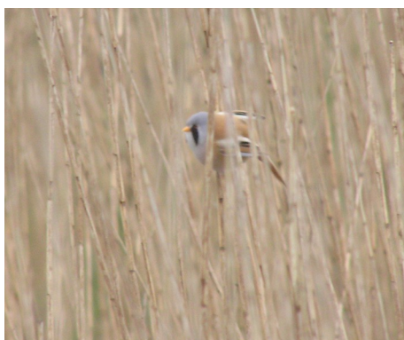
Skægmejse, Panurus biarmicus, han i rørskoven ved Han Vejle, d. 30. maj 2007

Derfor gik turen snart videre til rørskoven ved Han Vejle, hvor der er lavet en gangbro, der fører et godt stykke ud i rørskoven. Her hørte vi endelig en paukende Rørdrum , og der var masser af Vandrikser . Overalt hørtes deres grynten eller den accelererende serie af "pypp-pypp"er. Omkring os lød også en metallisk klingen fra rørene. Det var Skægmejser , der kommunikerede, medens de arbejdede sig helt op i toppen af rørene, flyttede sig nogle meter, hvor de "faldt ned" i rørene og atter arbejdede sig op.