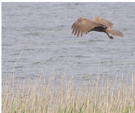
Rørhøg - hun, Circus aeroginosus, hun, fouragerende over Han Vejle, d. 30. maj 2007

Ved skjuleet lidt inde ad gangbroen fløj fire Sortterner rundt og fouragerede over rør og vand. Og over det samme område fouragerede fruen i familien Rørhøg :