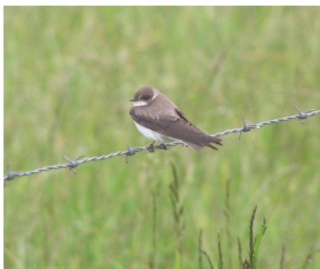
Digesvale, Riparia riparia, rastende ved Sneum Engsø, d. 29. maj 2007

Da vi ankom til Sneum, faldt regnen om muligt endnu tættere. Det blev til en del obs fra bilen samt et par spæde forsøg på at fange to minutters tørvejr, men alt-i-alt skuffende. Ingen af de sjove klirer, og det nærmeste vi kom en speciel måge, var ved synet af en ekstremt lys Hættemåge , der var helt hvid på ryggen og med kun grålig hætte - en spøjs og iøjnefaldende fætter :-)