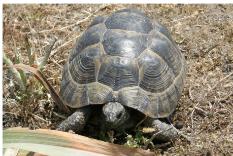
Græsk landskildpadde, Testudo graeca , Agra, d. 15. maj 2008