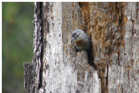
Kröpers spætmejse, Sitta krueperi, Achladeri, d. 14. maj 2008