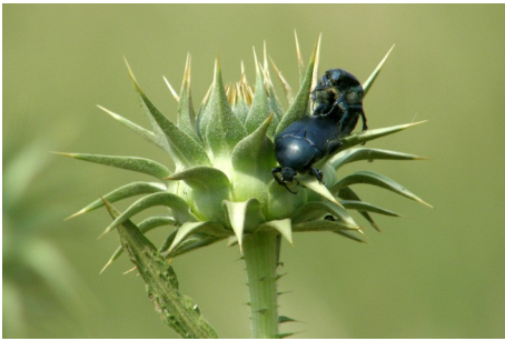
Ubestemt bille på Tidsel, Sigri, d. 17. maj 2008