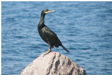
Topskarv, Phalacrocorax aristotelis, Skala Sikimmia, d. 13. maj 2008