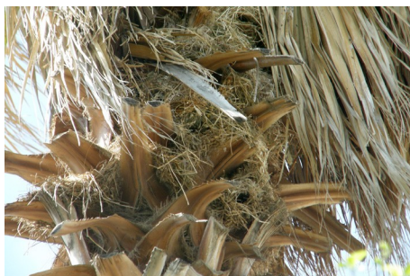
Spansk spurv , Passer hispaniolensis , og en af kolonierne i hotellets palmer. Hotel Kalemi i Skala Kalloni, d. 17. maj 2008