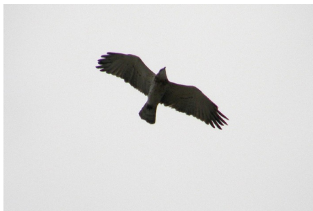
Slangeørn, Circaetus gallicus, ved Eressos, d. 15. maj 2008