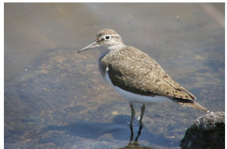
Mudderklire, Actitis hypoleucus, Salt Pans, d. 16. maj 2008