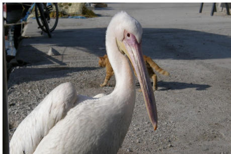
Almindelig pelikan, Pelecanus onocrotalus, Skala Kalloni, d. 18. maj 2008