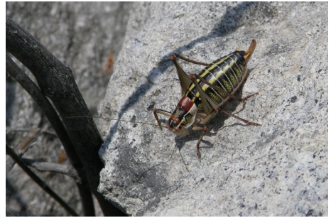
Ubestemt Græshoppe , ved Eressos, d. 15. maj 2008