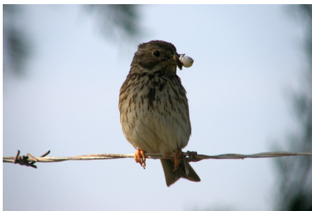
Bomlærke, Miliaria calandra, Salt Pans, d. 12. maj 2008