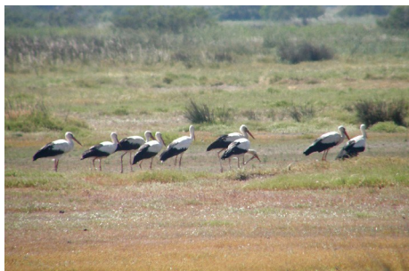
Hvid stork, Ciconia ciconia, 9 ud af en flok på 11, Salt Pans, d. 16. maj 2008