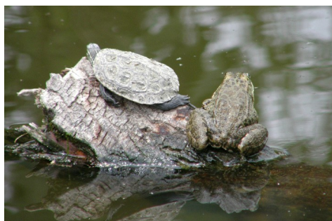
Kaspisk sumpskildpadde, Mauremys rivulata , og Latterfrø, Rana ridibunda , Inland Lake, d. 14. maj 2008