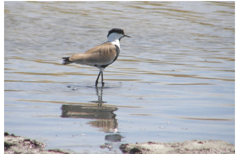
Sporevibe, Vanellus (Hoplopterus) spinosus, Salt Pans, d. 12. maj 2008