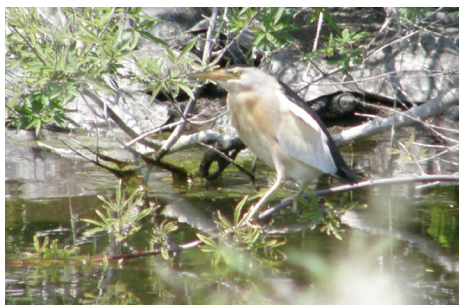
Dværghejre, Ixobrychus minutus, ved Eressos, d. 15. maj 2008