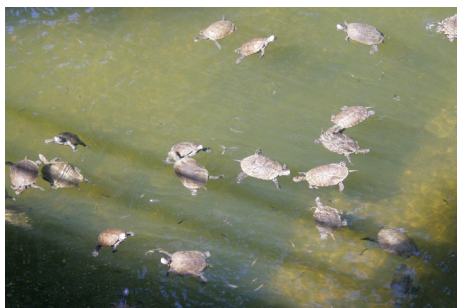
Kaspisk sumpskildpadde, Mauremys rivulata , Vouvaris River, d. 18. maj 2008