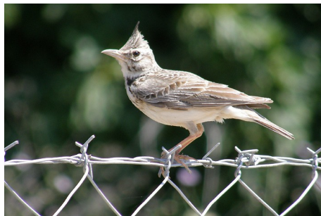
Toplærke, Galerida cristata, Potamia Valley, d. 17. maj 2008