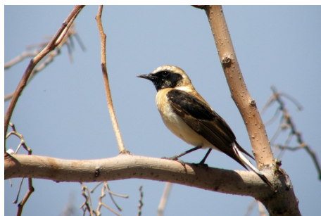
Middelhavsstenpikker, Oenanthe hispanica, Molivos, d. 13. maj 2008