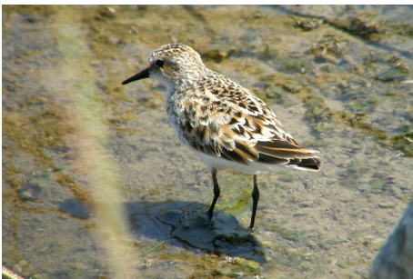
Dværgryle, Calidris minutus, Salt Pans, d. 16. maj 2008