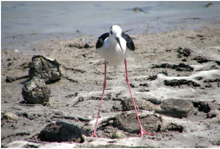
Stylteløber, Himantopus himantopus, Salt Pans, d. 16. maj 2008