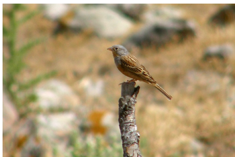
Rustværling, Emberiza caesia, Ipsilou, d. 17. maj 2008