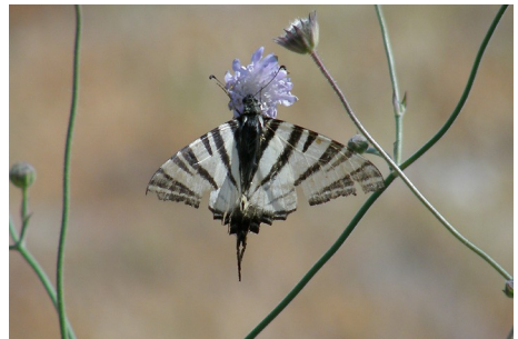
Sydeuropæisk svalehale , Iphlicides podalirius , Potamia Valley, d. 16. maj 2008