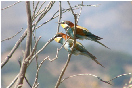
Blæder, Merops apiaster, Salt Pans, d. 16. maj 2008