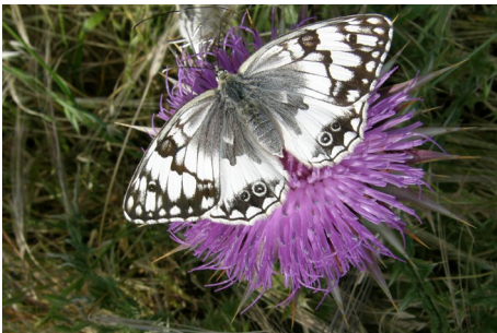
Randøje sp. , Melanargia larissa , Sigri, d. 17. maj 2008