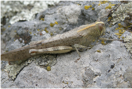
Ubestemt Græshoppe , Potamia Valley, d. 14. maj 2008