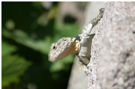
Hardun, Agame stellio , Molivos, d. 13. maj 2008