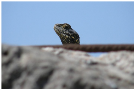
Hardun, Agame stellio , Molivos, d. 13. maj 2008