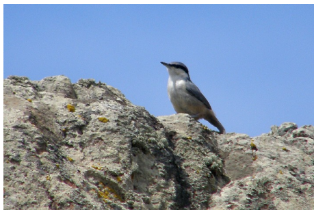
Klippespætmejse, Sitta neumayer, Salt Pans, d. 12. maj 2008