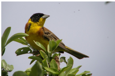
Hætteværling, Emberiza melanocephala, Sigri, d. 17. maj 2008