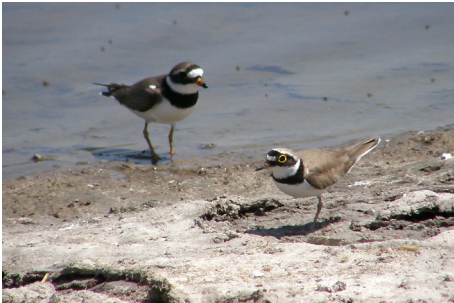
Stor præstekrave, Ch. hiaticula, & Lille præstekrave, Ch. dubius, Salt Pans, d. 16. maj 2008