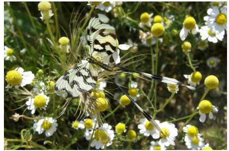
Netvinge sp. , Nemoptera sinuata , ved Eftalou, d. 13. maj 2008