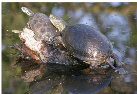
Kaspisk sumpskildpadde, Mauremys rivulata , og Europæisk sumpskildpadde, Emys orbicularis , Inland Lake, d. 18. maj