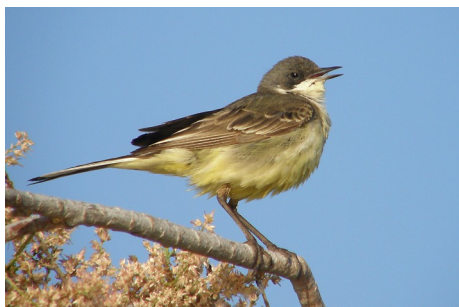
Sorthovedet gul vipstjert, Motacilla flava feldegg West River, d. 16. maj 2008