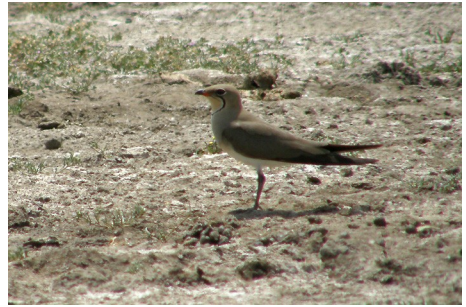
Rødvinget braksvale, Glareola pratincola, Salt Pans, d. 12. maj 2008