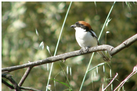
Rødhovedet tornskade, Lanius senator, Potamia Valley, d. 16. maj 2008